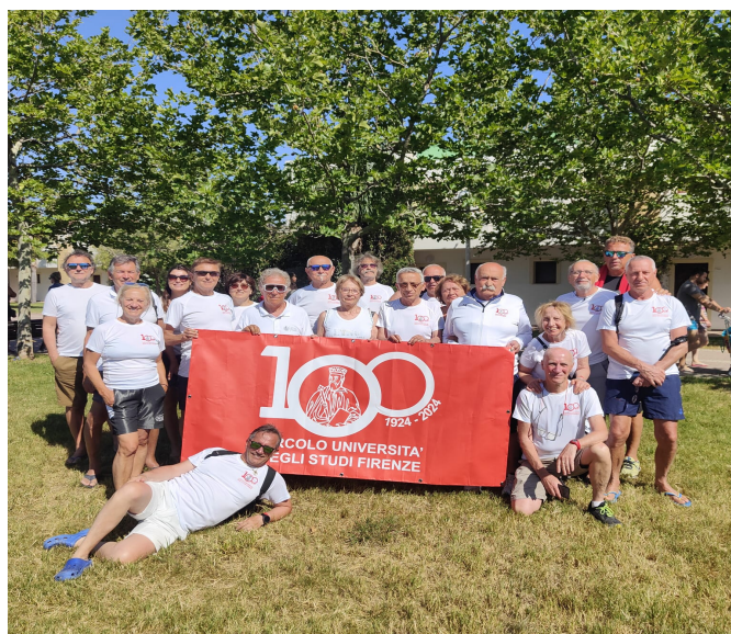
Torneo Nazionale Sibari 2024

La sezione Tiro con L' Arco per l'anno 2024 ha organizzato, in collaborazione con il