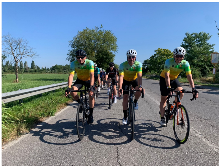
7 muri 17 marzo 2024

Molteplici sono state le uscite e gli allenamenti durante l'anno, che ci hanno portato dai Setti muri in Valdisieve ai Quattro Passi sulle Dolomiti. Tutti eventi inclusivi, che hanno permesso anche alle persone più anziane, dotate di e-bike, di raggiungere traguardi dimenticati.