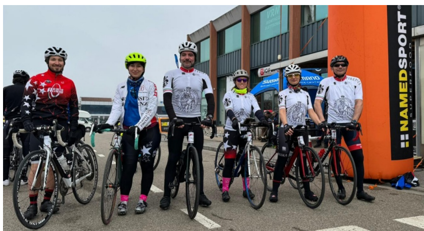
Quattro passi 8 giugno 2024

Molteplici sono state le uscite e gli allenamenti durante l'anno, che ci hanno portato dai Setti muri in Valdisieve ai Quattro Passi sulle Dolomiti. Tutti eventi inclusivi, che hanno permesso anche alle persone più anziane, dotate di e-bike, di raggiungere traguardi dimenticati.