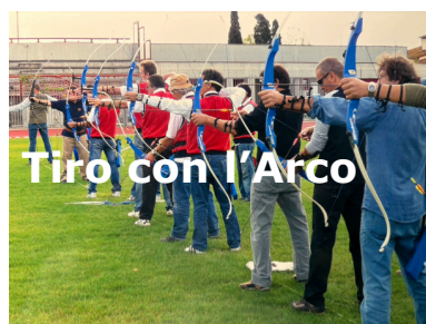
Tiro con l'Arco